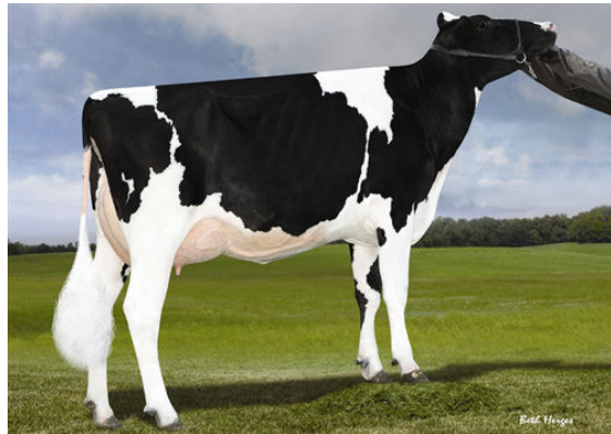
LADYS-MANOR S DAHLIA FIFTH DAM